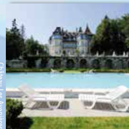
Château Les Avenues