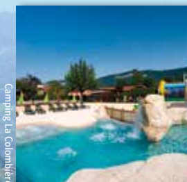
Camping La Colomnière