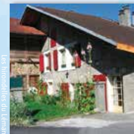
Les Hémondilles du Léman